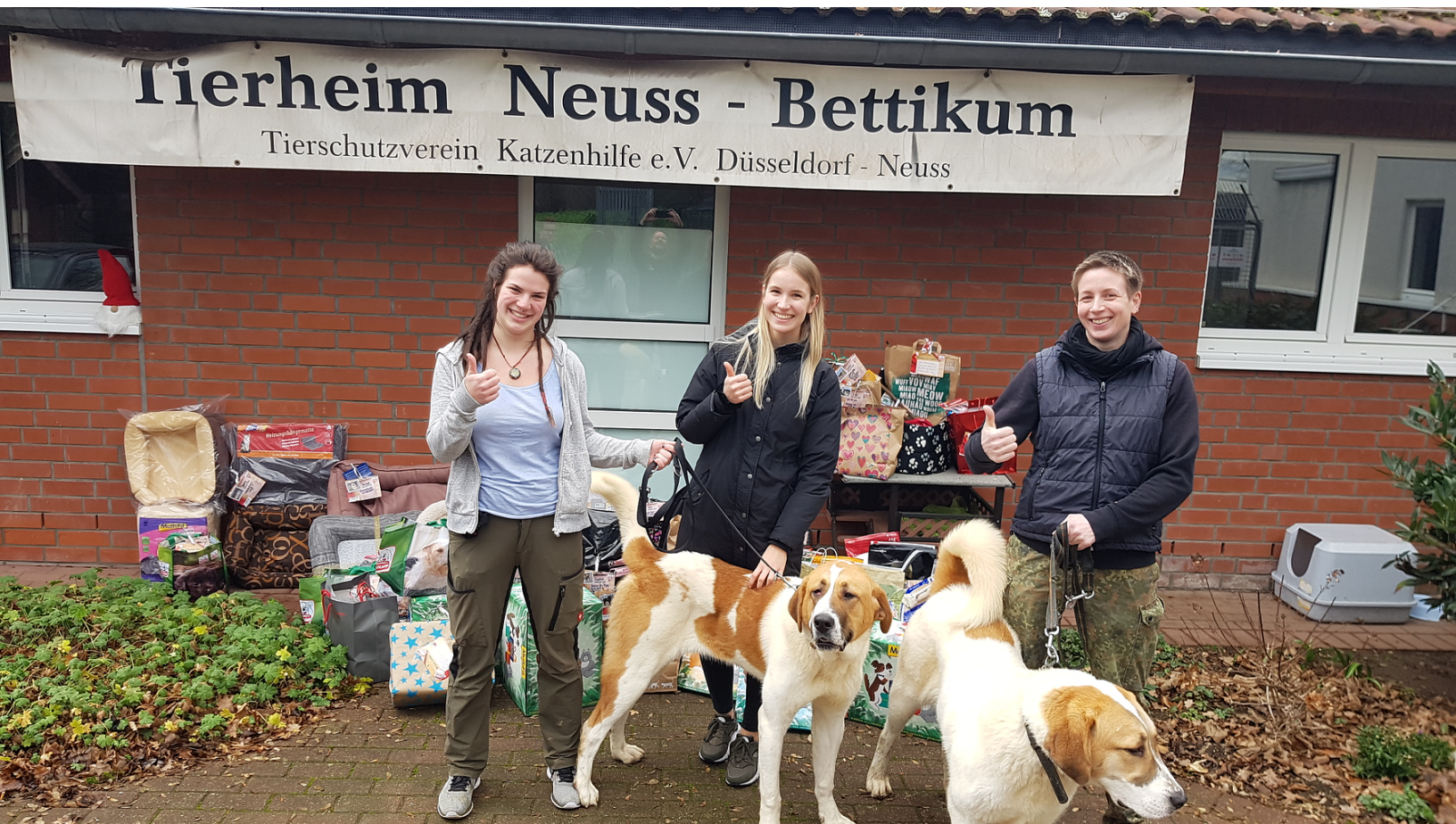
Tierheimwünsche werden wahr: Erste "Bescherung" von Fressnapf-Mitarbeitern im Tierheim Neuss-Bettikum