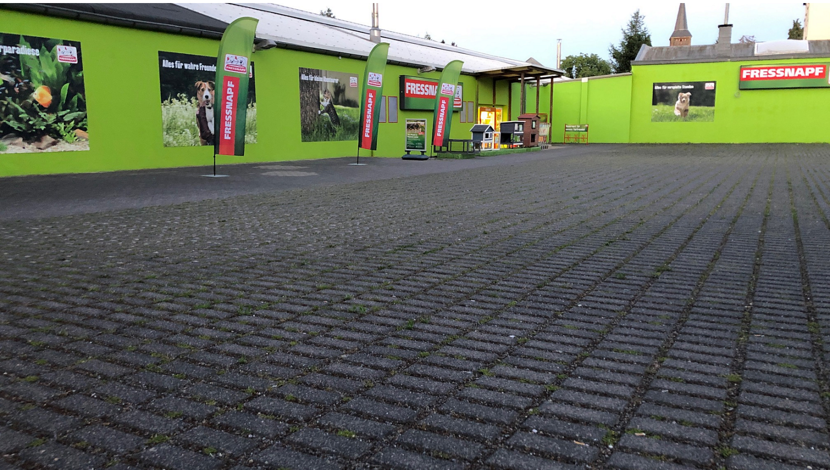
Die Außenansicht des neu eröffneten Fressnapf-Marktes in Leverkusen-Opladen