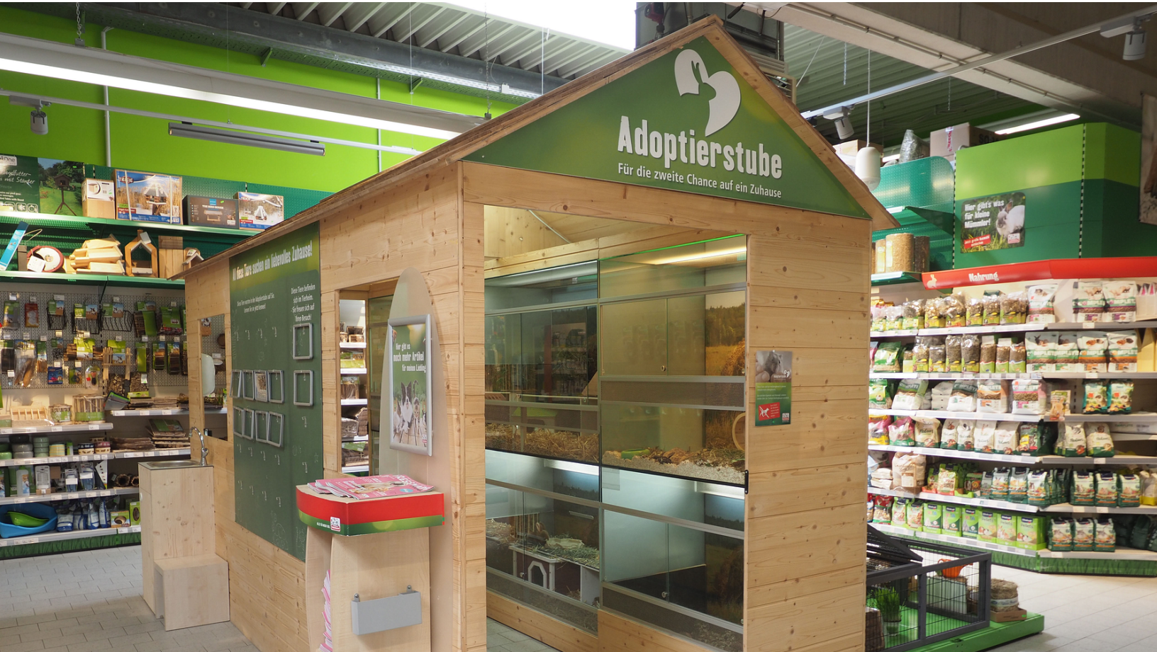
Die Adoptierstube im Fressnapf-Markt Tübingen