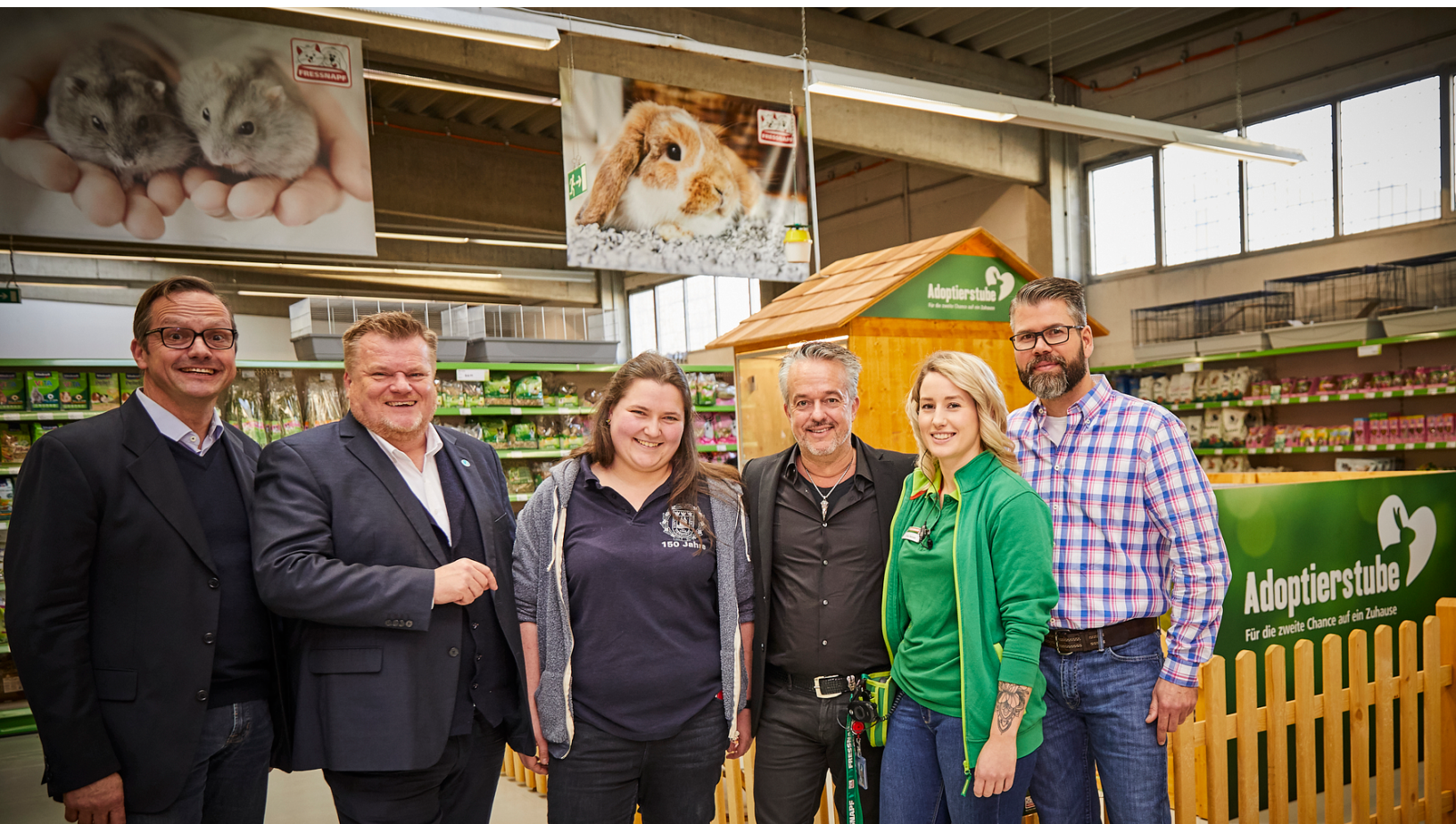
Eröffnung der Adoptierstube in Köln-Porz