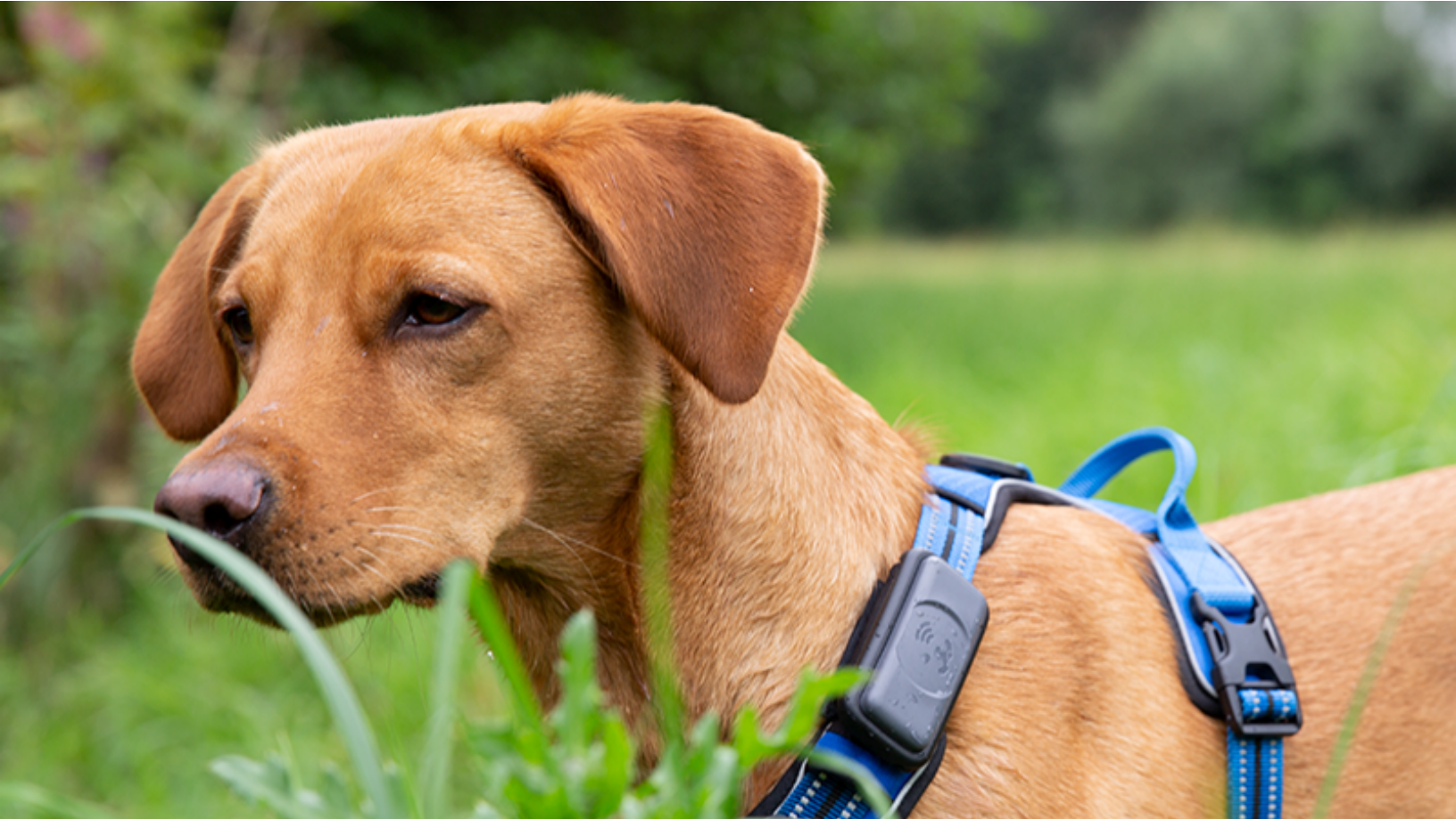
Praktisch und kompakt: Der Fressnapf GPS Tracker am Geschirr eines Hundes im Gelände