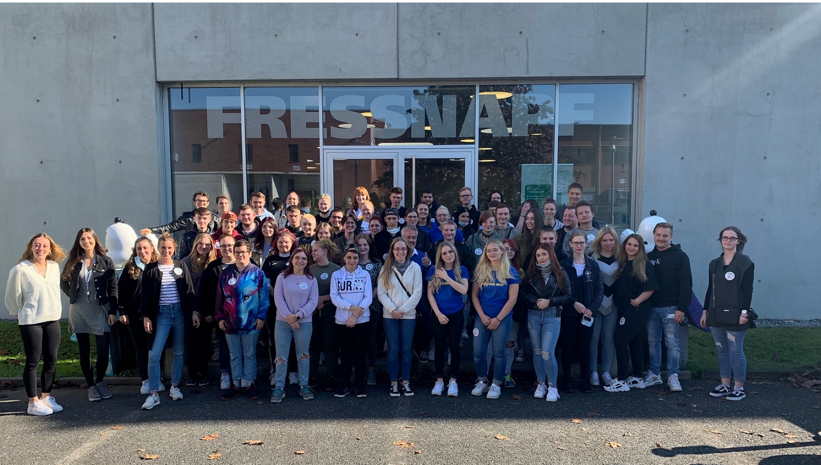
Frisch getestet und gut gelaunt: Fressnapf-Azubis freuen sich auf ihre neuen Aufgaben im Unternehmen.