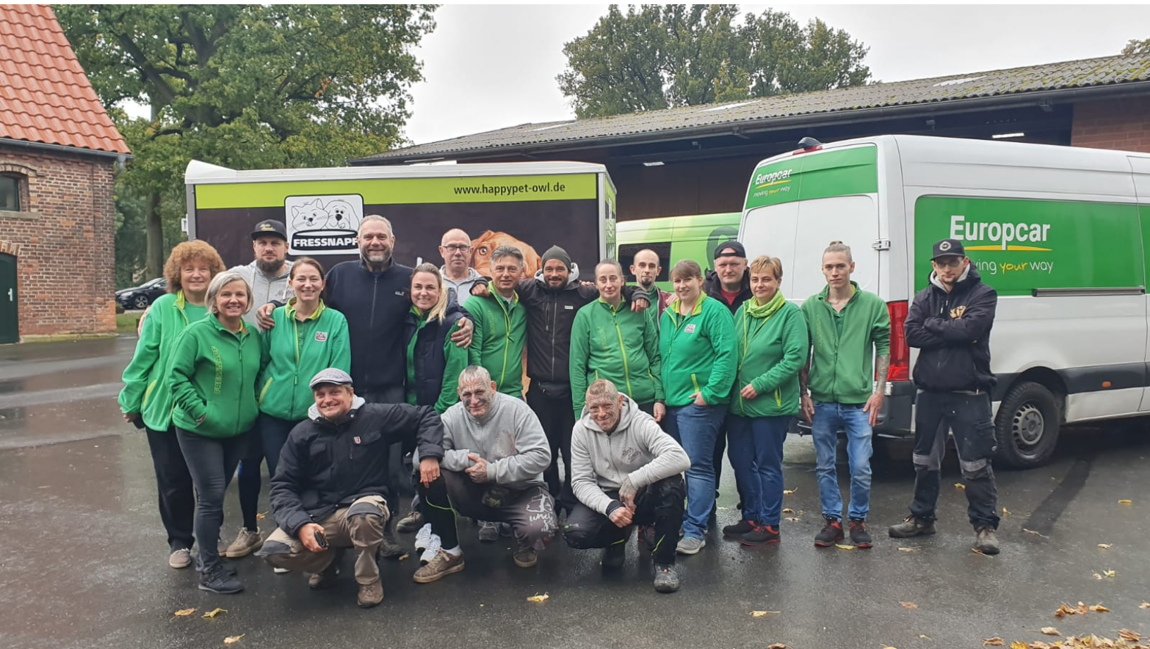
Fressnapf-Team und die Harten Hunde sind für den Lebenshof Tierisches Glück e.V. im Einsatz