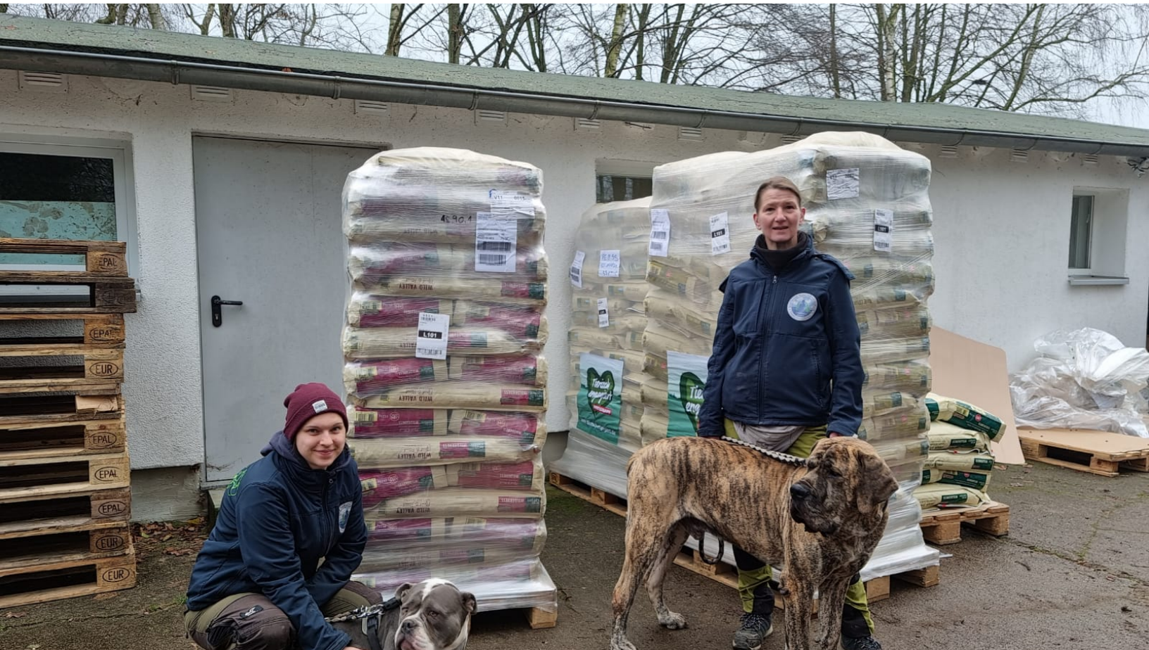
Fressnapf-Logistikdienstleister Möhlmann&Teschner übergibt zehn Spendenpaletten in Mecklenburg-Vorpommern.